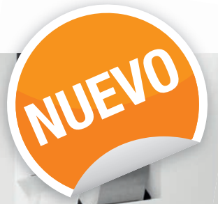
Lámina para pavimentos cerámicos removibles